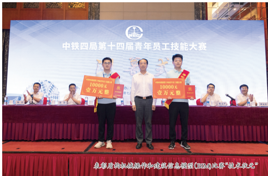
表彰盾构机械操作和建筑信息模型(BIM)比赛“技术状元”