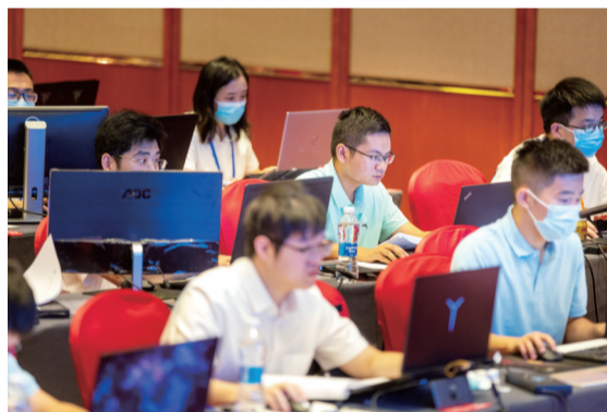
▲建筑信息模型(BIM)选手现场建模考试