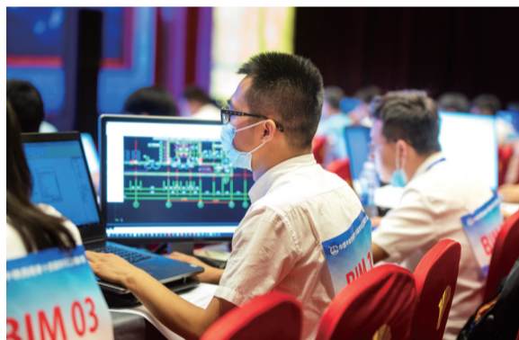
▲建筑信息模型(BIM)比赛选手通过建模软件还原建筑效果