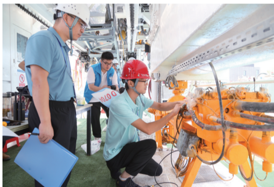
▲盾构机械操作比赛选手排除设备故障