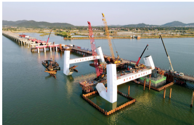
▲花山大桥跨湖桥施工