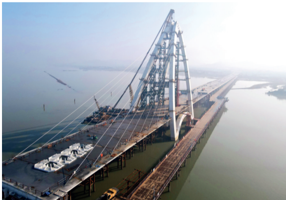
▲施工中的花山大桥