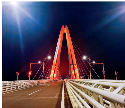
▲花山大桥通车 ▼花山大桥主塔合龙

9月28日零时,南京市高淳区环湖线主线工程花山大桥正式开通。承建单位中铁四局二公司以一份人民满意、社会放心的答卷,献礼党的二十大!