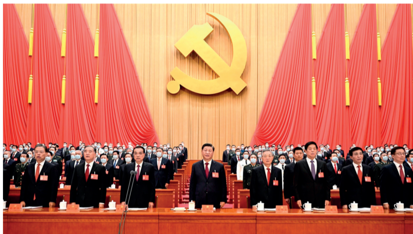
10月16日,中国共产党第二十次全国代表大会在北京人民大会堂开幕。这是习近平、李克强、栗战书、汪洋、王沪宁、赵乐际、韩正、胡锦涛在主席台上。

大会的主题是:高举中国特色社会主义伟大旗帜,全面贯彻新时代中国特色社会主义思想,弘扬伟大建党精神,自信自强、守正创新,踔厉奋发、勇毅前行,为全面建设社会主义现代化国家、全面推进中华民族伟大复兴而团结奋斗