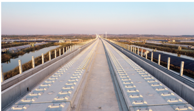
▲无砟轨道施工成型段