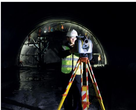
▲隧道初支断面扫描