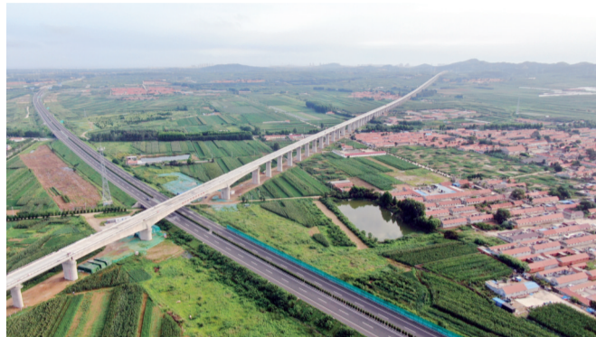
▼跨烟海高速特大桥