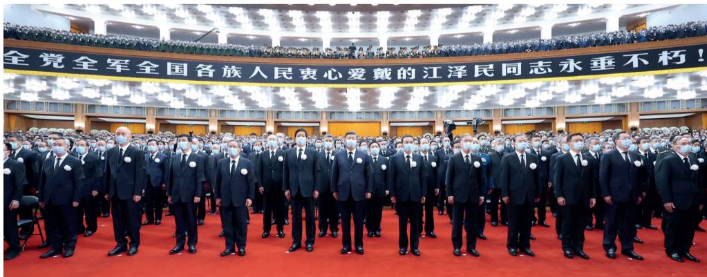
12月6日，中共中央、全国人大常委会、国务院、全国政协、中央军委在北京人民大会堂隆重举行江泽民同志追悼大会。习近平、李克强、栗战书、汪洋、李强、赵乐际、王沪宁、韩正、蔡奇、丁薛祥、李希、王岐山等参加大会。