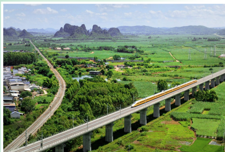
七分公司南崇铁路项目渠黎双线特大桥