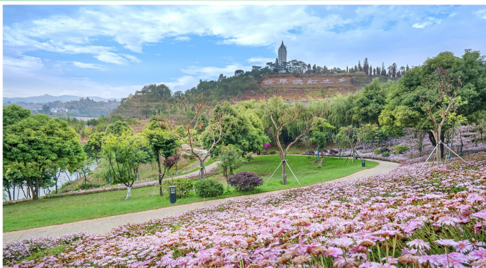
三公司云南省凤庆县流域治理项目砚池公园绿化工程