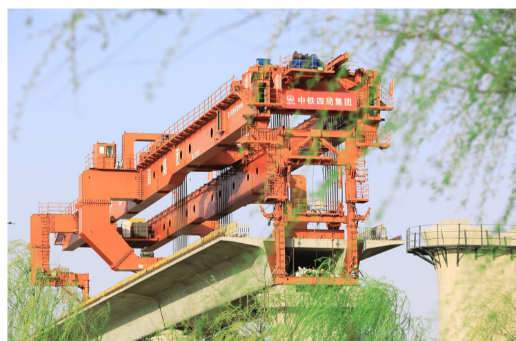
四公司合新铁路项目合肥东1号特大桥箱梁架设