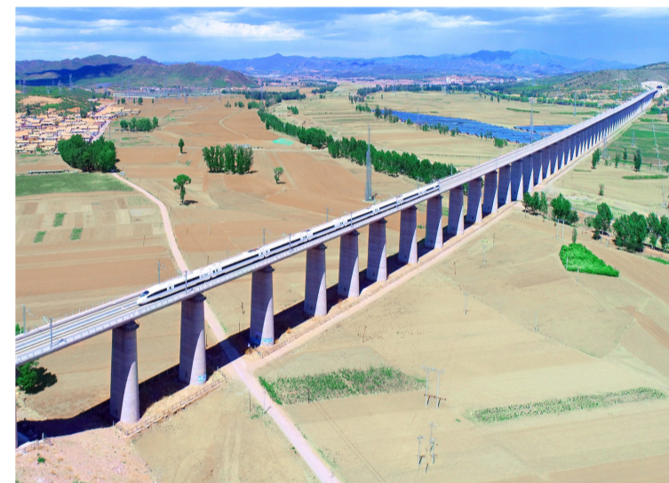
一公司京沈铁路河北段项目老牛河特大桥