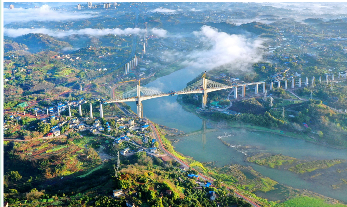
二公司渝昆高铁川渝段项目沱江特大桥合龙