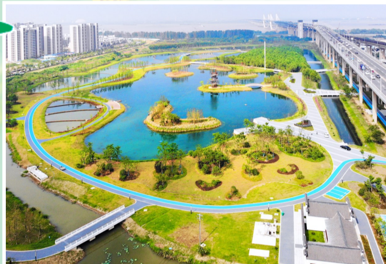
市政公司芜湖朱家桥尾水净化生态公园