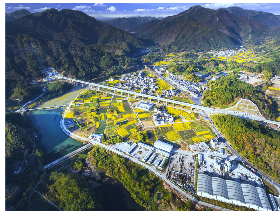
四公司昌景黄铁路项目休宁河特大桥开始静态验