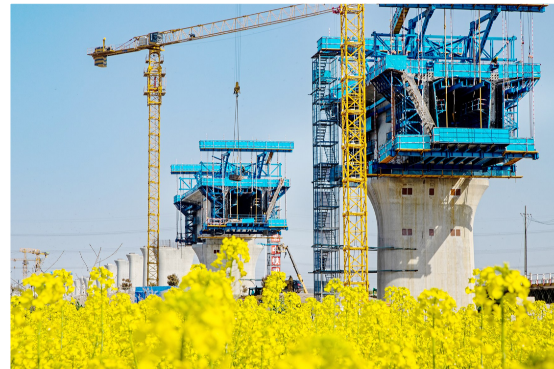
四公司巢马城际铁路项目当涂侧引桥挂篮施工