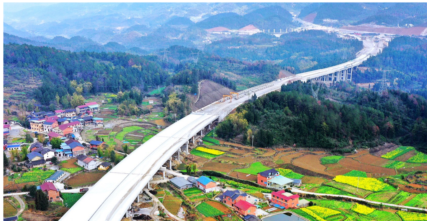
六公司渝湘复线高速公路项目徐家坝大桥桥面系施工