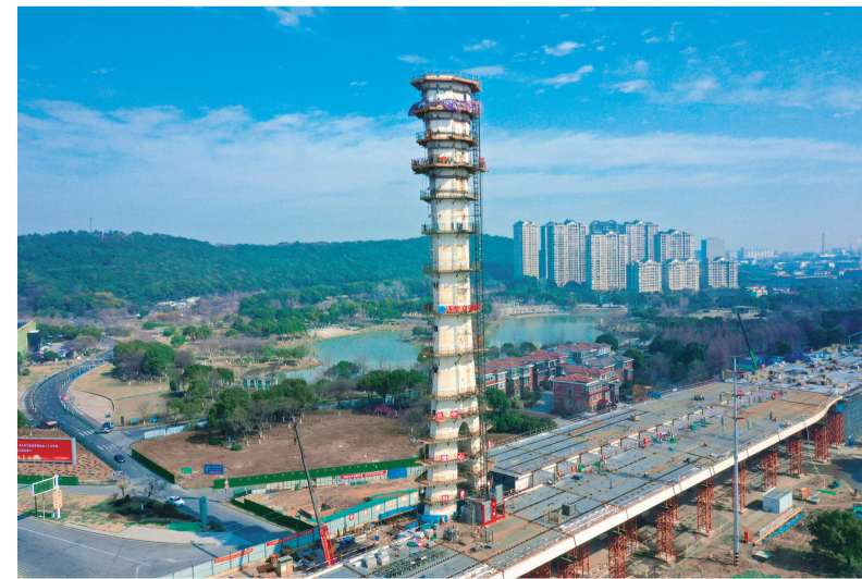
四公司合新铁路项目合肥东1号特大桥箱梁架设