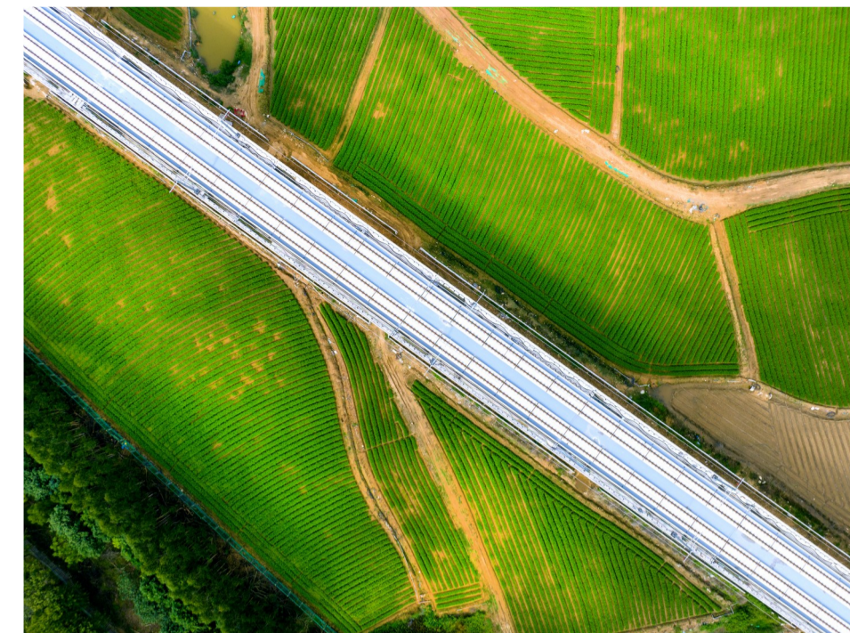
五公司福州至厦门高速铁路西溪特大桥穿越在田野中