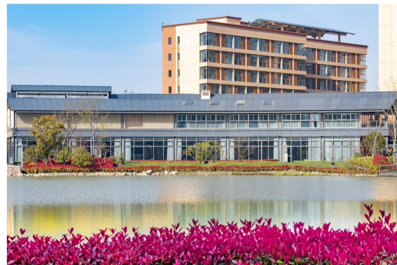
房地产公司中铁佰和佰崇一期项目湖滨餐厅