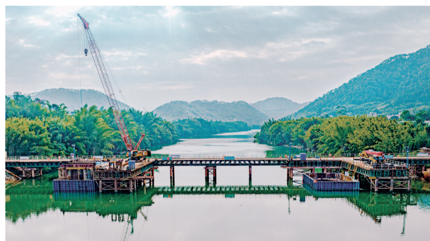
五公司黄河特大桥水中栈桥打通