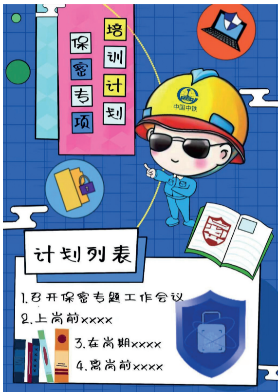
《用心做好保密工作》