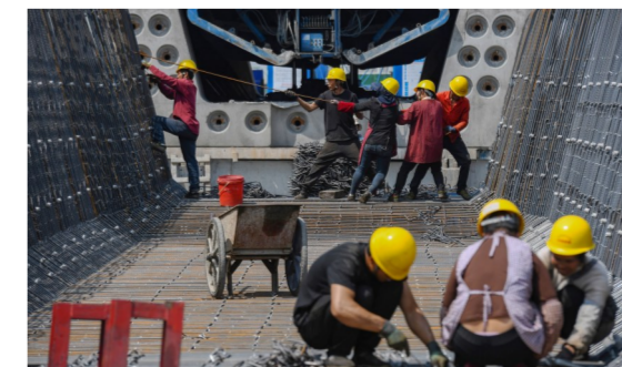
四公司磨店家园安置房项目部作业人员绑扎钢筋