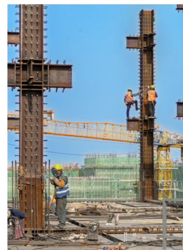
建筑公司合肥理工学院项目部作业人员进行钢结构焊接