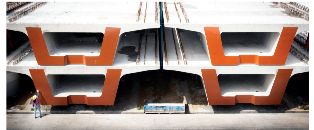
四公司合新铁路众兴制梁场作业人员粉刷油漆

启动仪式结束后,《人民日报》摄影部主任、高级记者、中国新闻摄影学会副会长雷声,《解放军画报》杂志社社长、中国摄影家协会副主席、中国摄影家协会第九届艺术摄影委员会主席柳