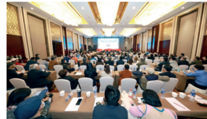
启动活动现场

本报合肥讯 “五一”国际劳动节即将来临之际,4月25日,主题为“弘扬劳动精神 创造美好生活”的国企开放日·中央、省、市主流媒体走进中铁四局暨合肥市最美工程最美劳动者摄影大赛启动。