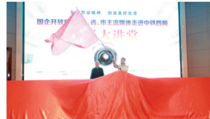
采风投旗