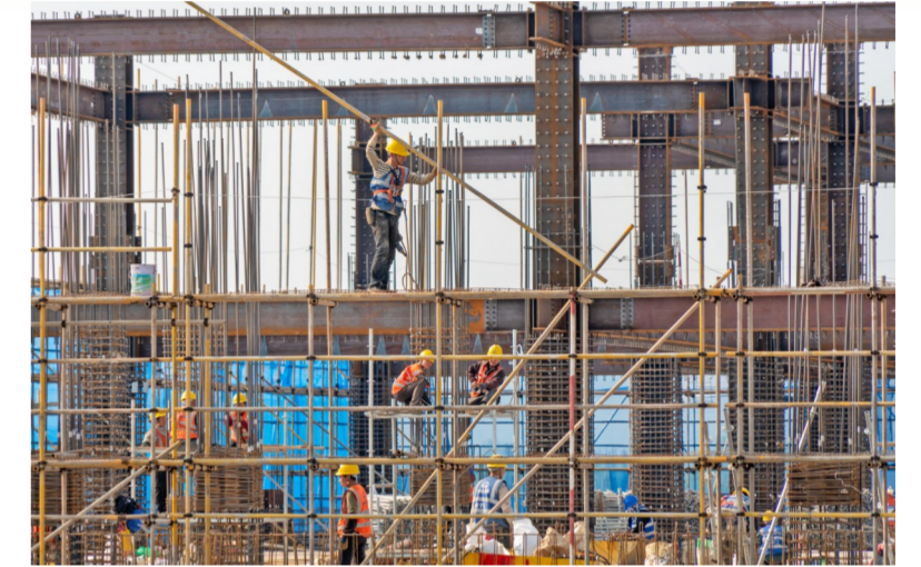
建筑公司合肥理工学院项目部作业人员进行外架搭设