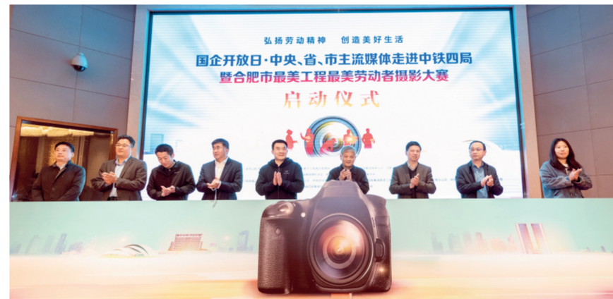
国企开放日·中央省市主流媒体走进中铁四局暨合肥市最美工程最美劳动者摄影大赛活动启动