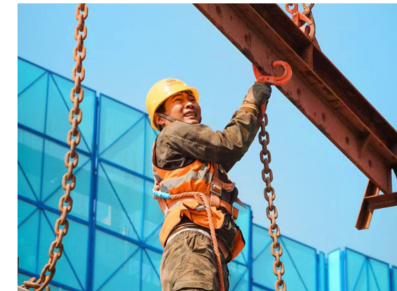
四公司磨店家园安置房项目部作业人员吊装楼板