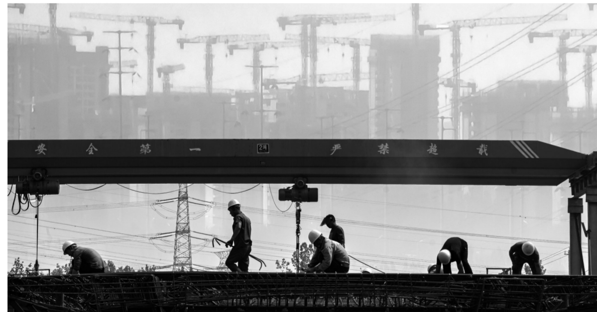
四公司合新铁路制梁场作业人员绑扎钢筋