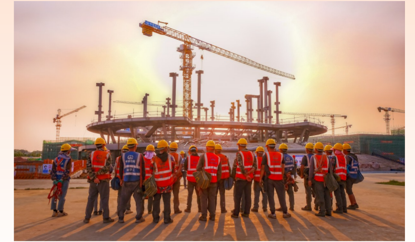
建筑公司合肥理工学院项目部作业人员接受安全教育