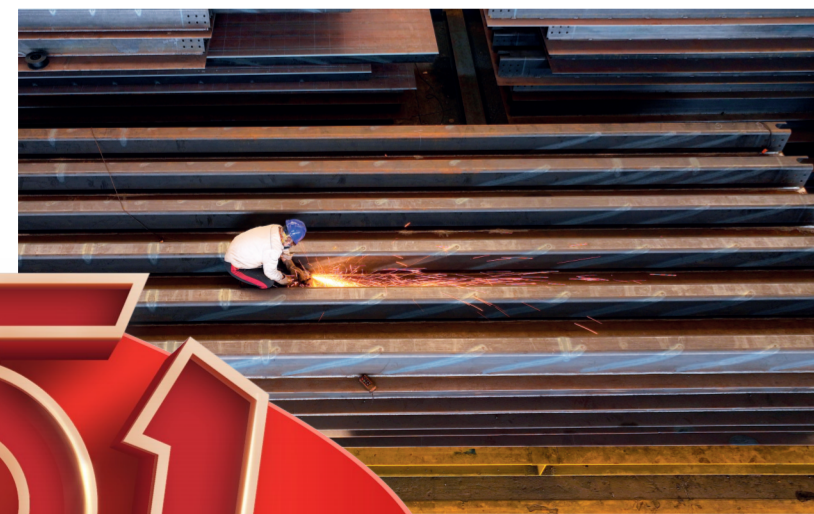
钢结构建筑公司制造分公司电焊作业