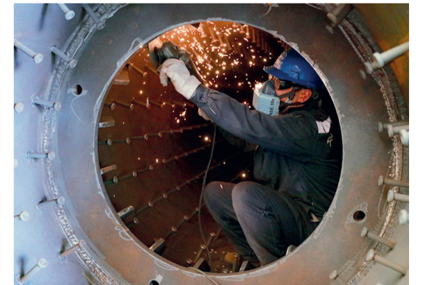
钢结构建筑有限公司制造分公司作业人员打磨产品部件