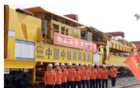
四川省工人先锋号 八分公司汉巴南铁路6标项目部