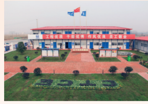
安徽省工人先锋号 市政公用池州老旧小区改造项目