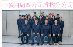
中铁四局四公司盾构分公司