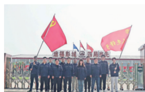
江苏省工人先锋号 二公司徐州三环南路改造工程4标项目部