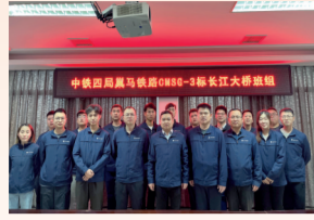
安徽省工人先锋号 四公司巢马铁路3标长江大桥施工班组