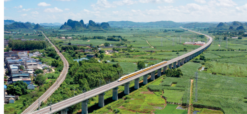
安徽省五一劳动奖状 七分公司