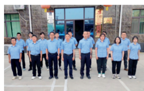
河北省工人先锋号 三公司保定府河水系综合治理一期黄花沟综合治理工程项目部