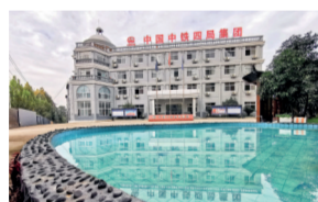
江西省工人先锋号 五公司九江水环境综合治理项目部