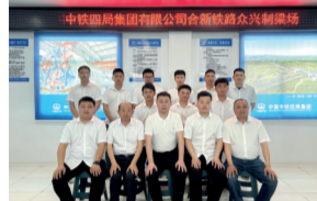
安徽省工人先锋号 四公司合新铁路兴兴制梁场