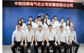
安徽省工人先锋号 电气化公司安徽铁路分公司