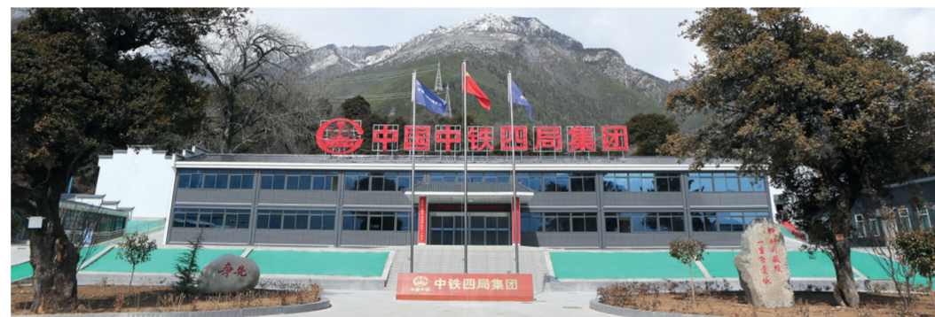
中铁四局CZ铁路CZXZZQ-6标项目部