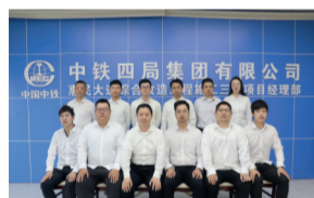
江苏省工人先锋号 二公司南京惠民大道综合改造工程3标项目部