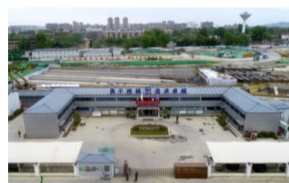
江苏省工人先锋号 二公司南京建宁西路过江通道A5标项目部