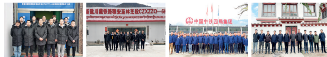
中铁四局CZ铁路CZXZZQ-6标项目部物资分部 中铁四局CZ铁路CZXZZQ-6标项目部检测分部测量组 中铁四局CZ铁路CZXZZQ-6标项目部四分部 中铁四局CZ铁路CZXZDL-3标项目部一分部