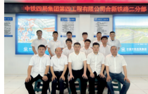
安徽省工人先锋号 四公司合新铁路二分部