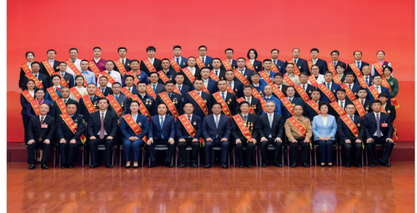
全国五一劳动奖状 电气化公司