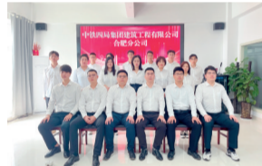
安徽省工人先锋号 建筑公司合肥分公司