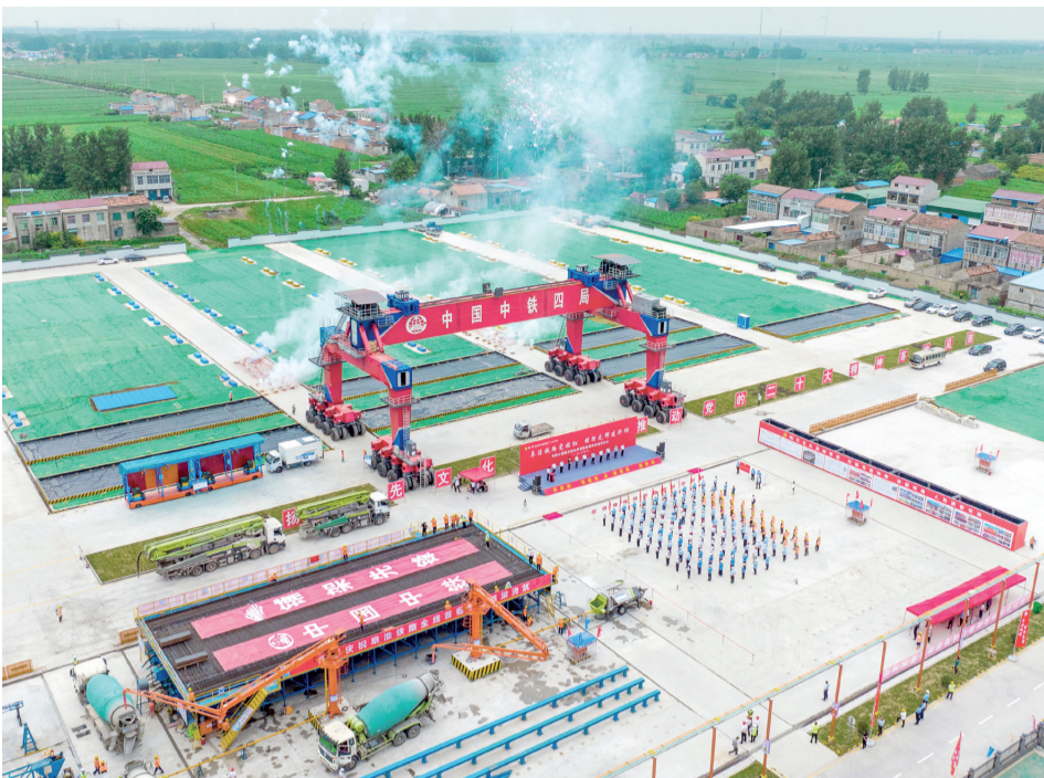
双堆集制梁场首榀新型箱梁正式浇筑