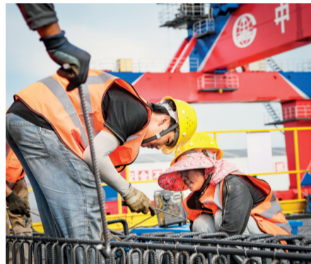
工人正在绑扎钢筋