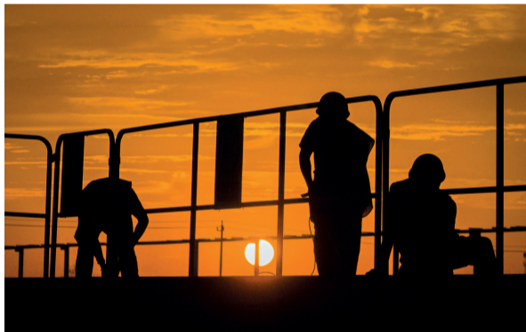
绑扎钢筋工人劳作剪影