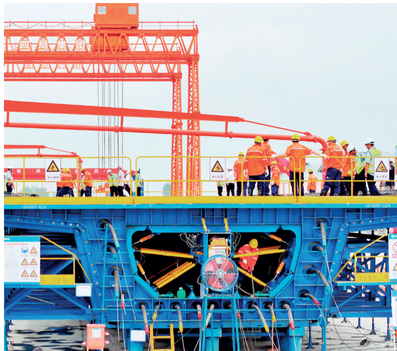
阜淮铁路全线首榀新型箱梁浇筑现场