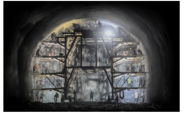
昌景黄铁路云头山隧道掌子面施工