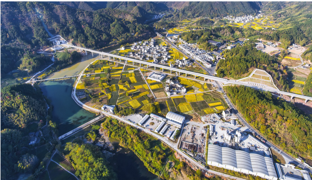
昌景黄铁路休宁河特大桥梁秋景