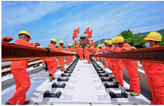
昌景黄铁路铺轨施工