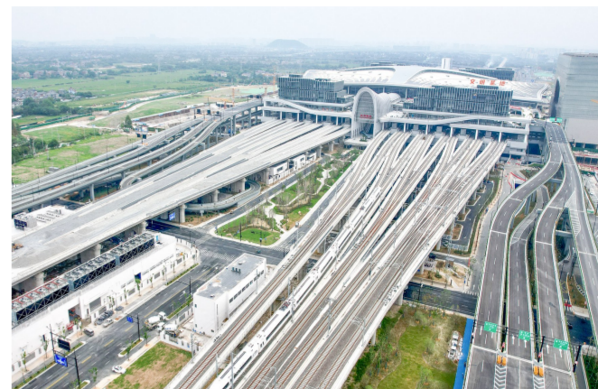
湖杭铁路杭州西站动车所

中铁四局二公司、建筑公司、城轨分公司承建的湖杭铁路杭州西站动车所是目前浙江省内规模最大的动车所,该项目投入使用后拉动周边经济、文化、交通和旅游业发展,增加杭州铁路枢纽运营的灵活度,大幅提升杭州动车的始发终到能力,极大方便旅客出行。