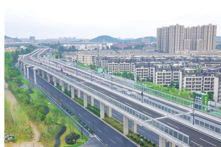
S304余杭小林至塘栖段改扩建工程

中铁四局一公司承建的S304余杭小林至塘栖段改扩建工程,全长5.88千米,在建设过程中严格遵守杭州市各项环保要求,始终坚持打造“绿色工程”,作为杭州市亚运会保畅通快速路网之一,项目于2022年6月28日通车放行,完善了杭州市及临平区快速路网,进一步拉近临平区与主城区的距离。