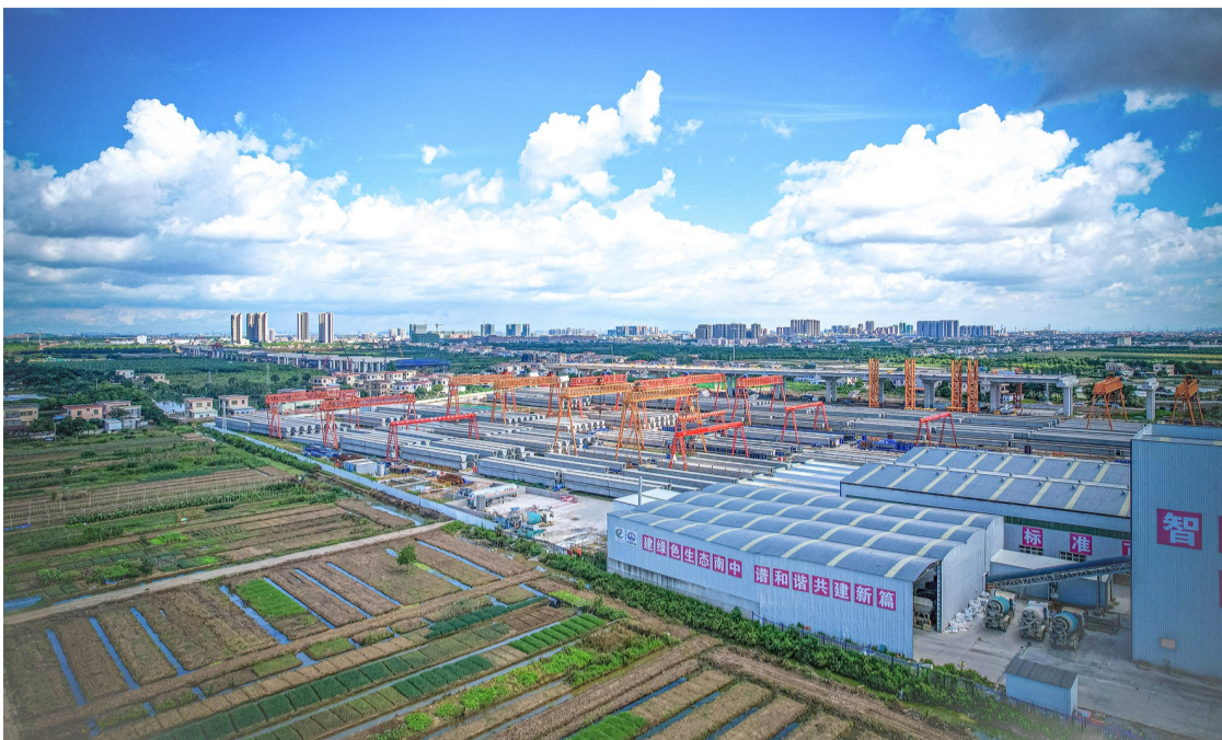
南中高速梁厂全景