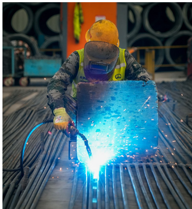
工人正在进行钢筋接头焊接工作