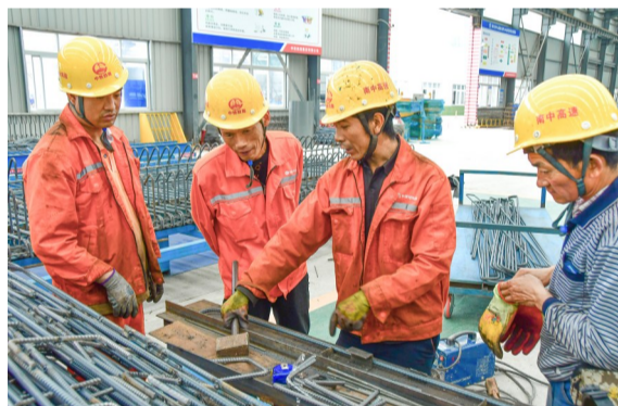
梁厂工人就钢筋加工技巧进行探讨