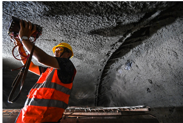
二公司成渝中线项目工人正在进行隧道瓦斯检测