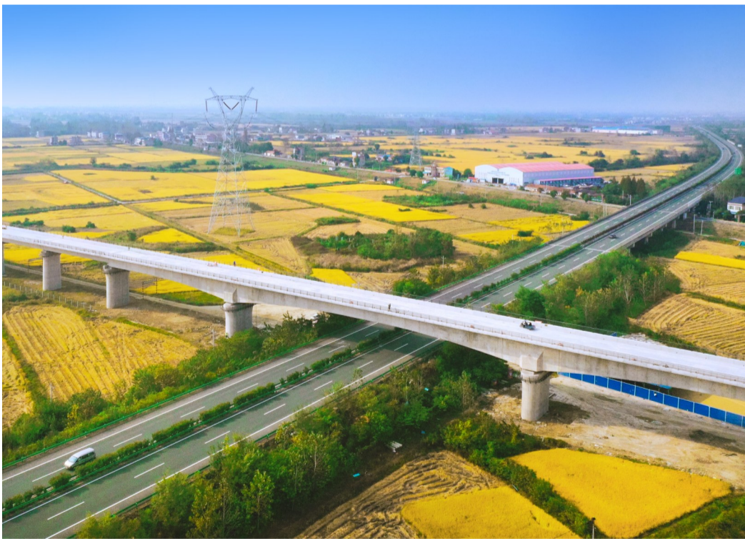
一公司沪渝蓉高铁武宜段2标二分部已建成的跨孝洪高速连续梁