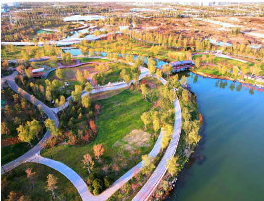
三公司承建的雄安新区绿化工程通过验收