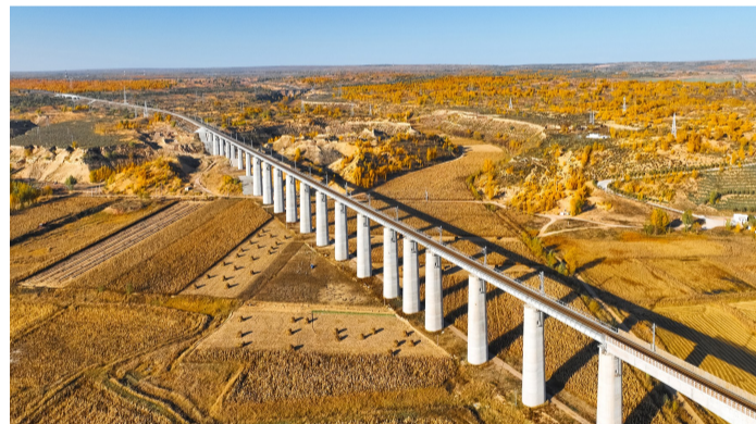
六公司承建的靖(边)至神(木)铁路运煤专线铁路无定河特大桥