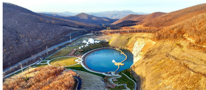
路桥公司承建的宝清县翡翠湖公园