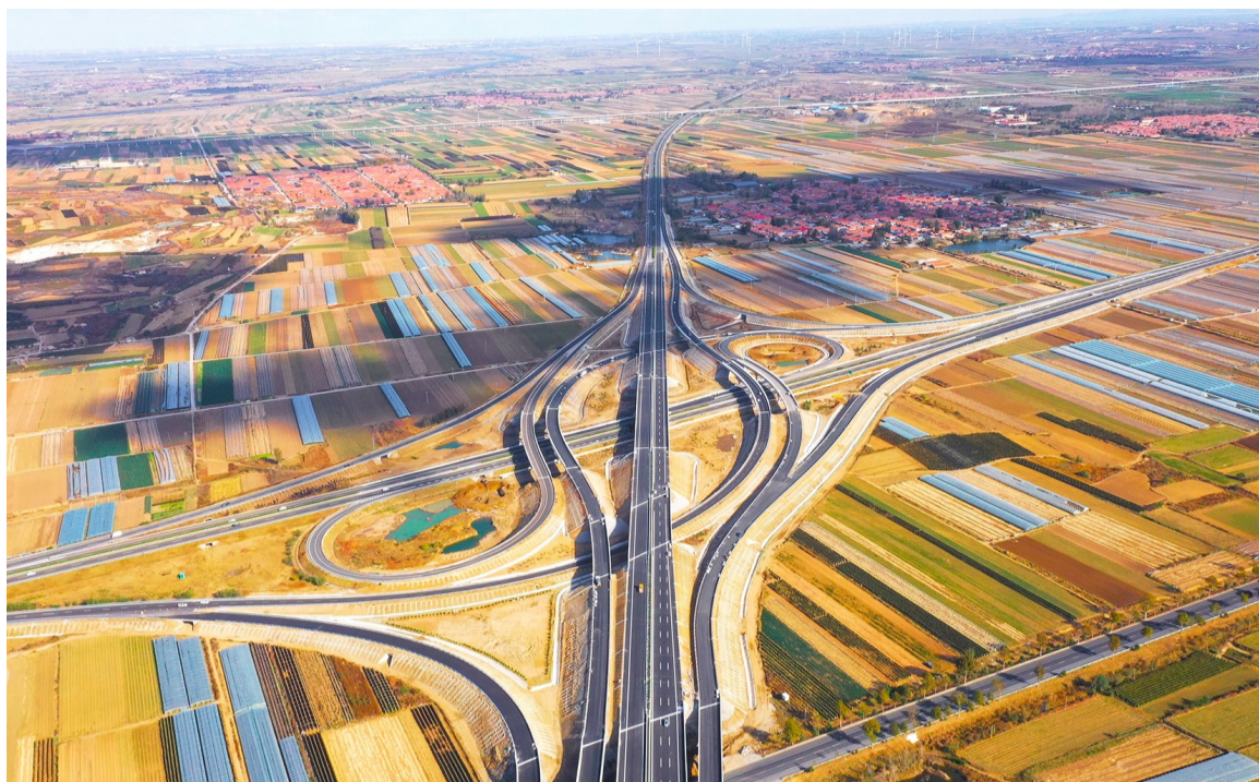
七分公司承建的明(村)董(家口)高速公路1标项目明村西枢纽