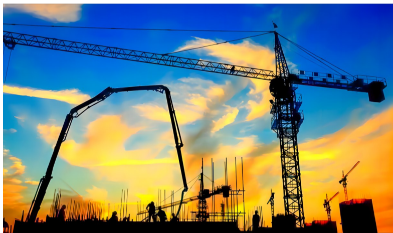
五公司揭惠铁路跨甬莞揭普惠特大桥施工