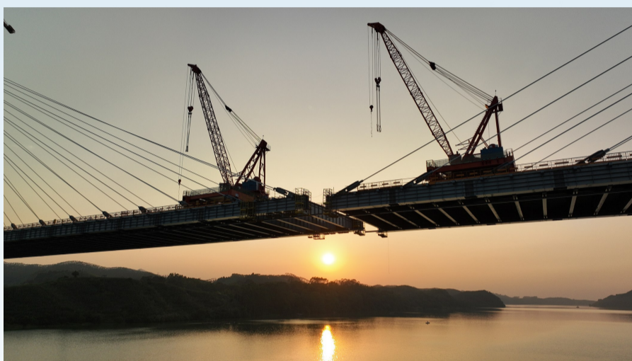
夕阳下的主跨合龙段