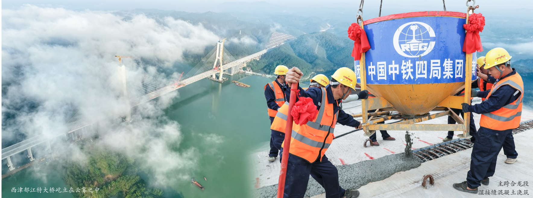
西津郁江特大桥屹立在云雾之中