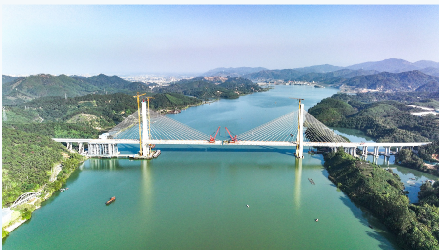
西津郁江特大桥全景