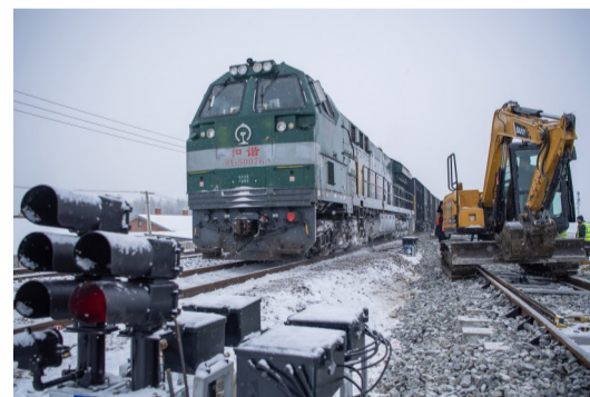
货运列车安全通过既有线