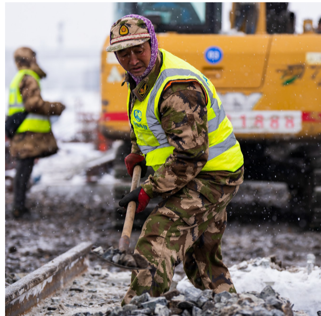
施工人员清理道砟