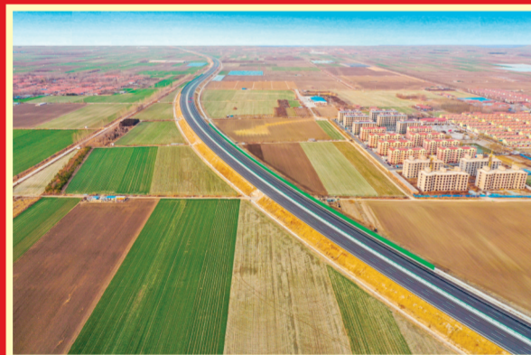
2023年12月15日,明(村)董(家口)高速公路建成通车