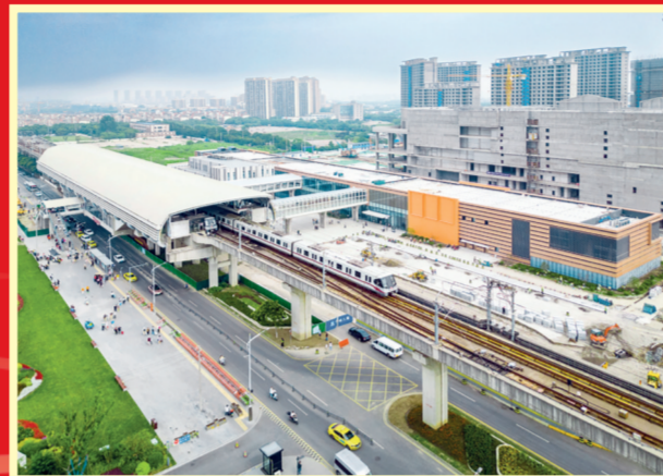
2023年6月24日,苏州轨道交通11号线开通运营