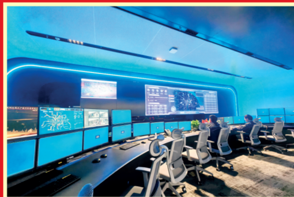
2023年12月29日,上海轨道交通C3(网络运营指挥调度中心)生产管理中心投入使用