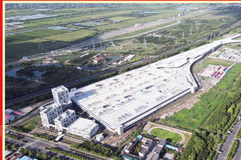
2023年12月27日,南通轨道交通2号线开通运营