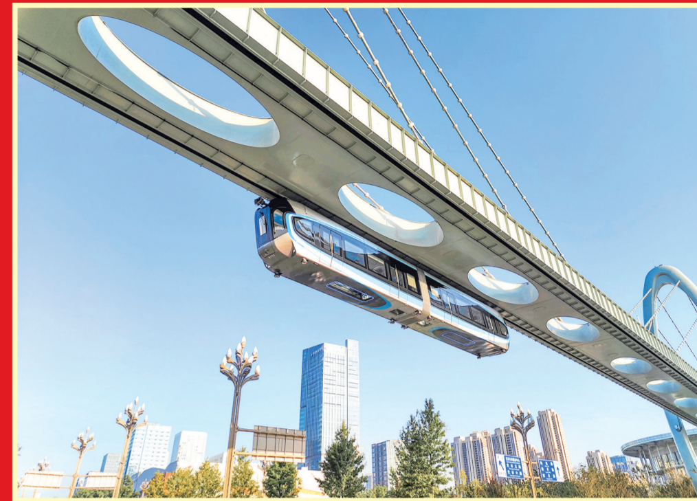
2023年9月26日,武汉光谷空中轨道一期开通运营