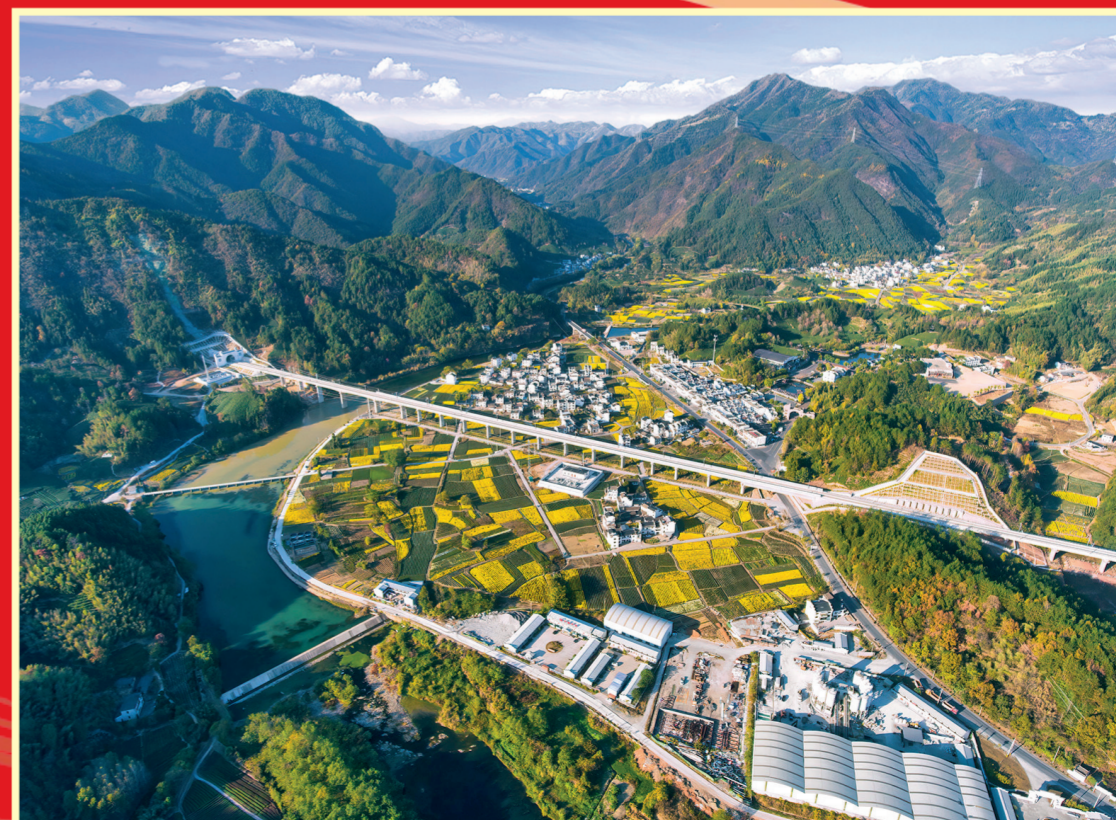
2023年12月27日,杭(州)南(昌)高速铁路开通运营