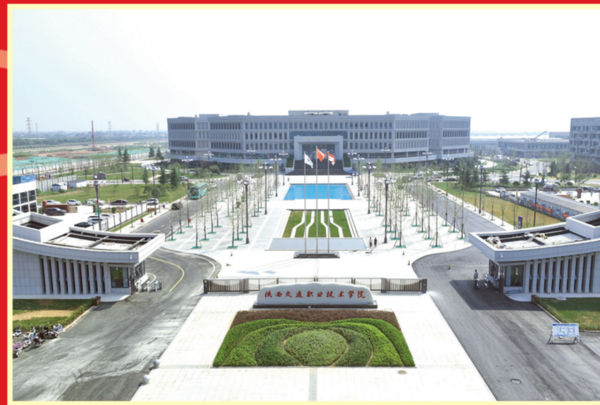
2023年9月8日,陕西交通职业技术学院通远校区投入使用