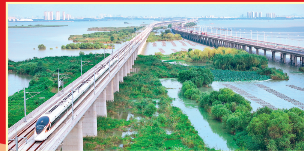
2023年9月28日,沪(上海)宁(南京)沿江高速铁路开通运营