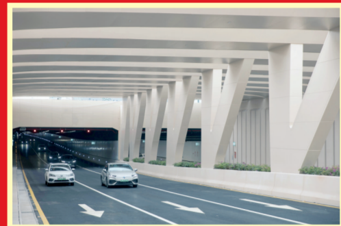
2023年3月21日,深圳市黄木岗交通枢纽下沉隧道建成通车