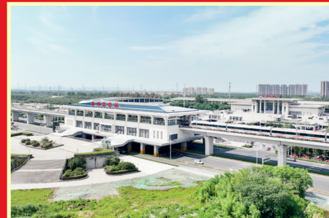
2023年6月28日,滁(州)宁(南京)城际铁路滁州段开通运营