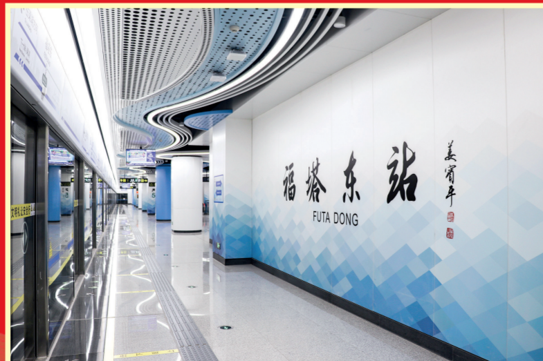
2023年12月20日,郑州轨道交通12号线一期开通运营