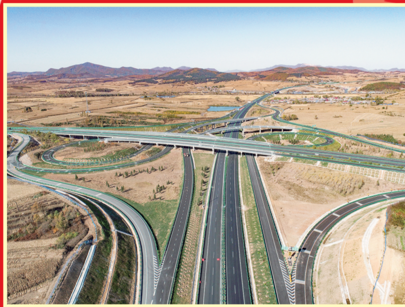
2023年11月30日,延(吉)长(春)高速公路大蒲柴河至烟筒山段建成通车