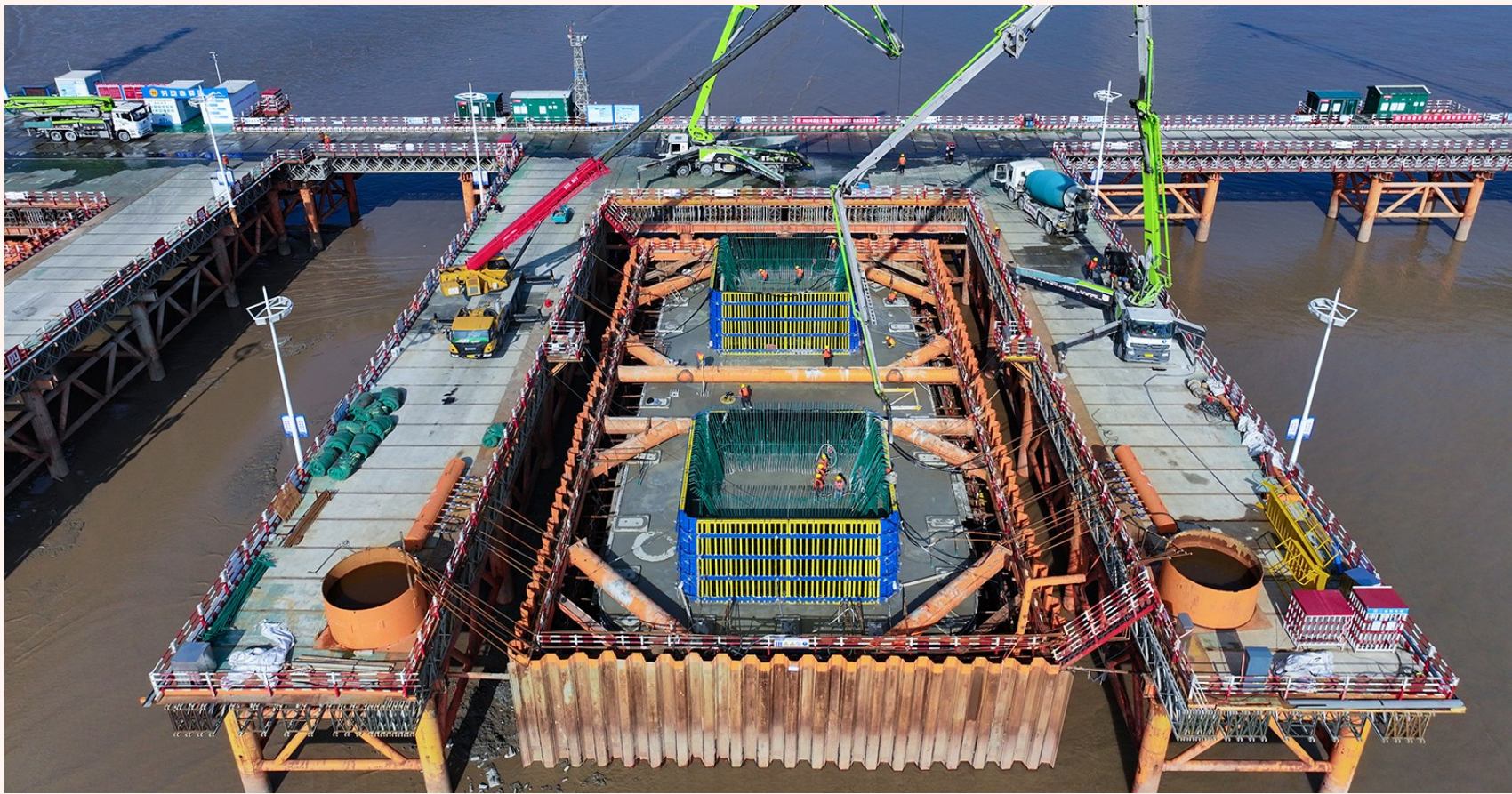
二公司甬舟铁路西堠门特大桥2号墩承台浇筑