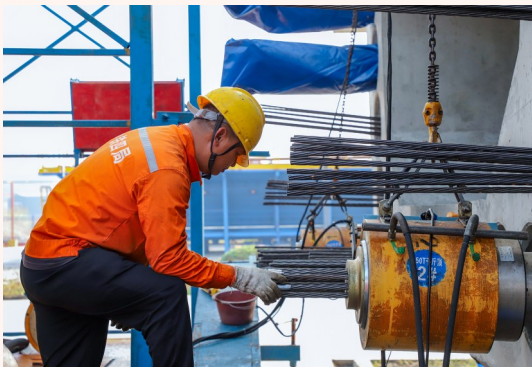
二公司沪通铁路祝慧制梁场锚筋安装进行验收