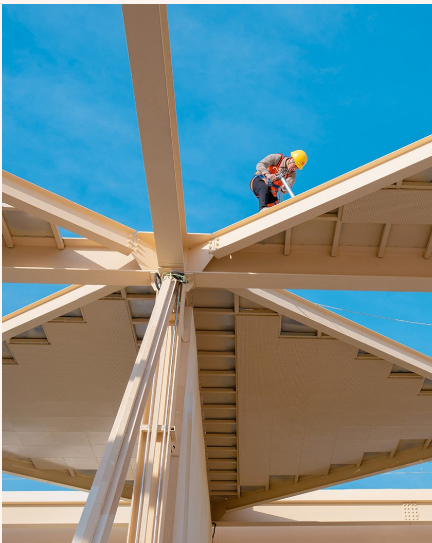
五公司深圳滨海大道项目工人在安装光过渡吸音板