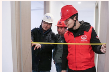
房地产公司仪表厂项目开展精装修验收

新年到来之际,中铁四局所属各公司员工坚守岗位,用拼搏奉献和砥砺前行,绘就节日里的一道道动人风景。