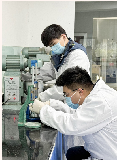
工程材料公司合肥生产基地研发人员开展产品性能试验