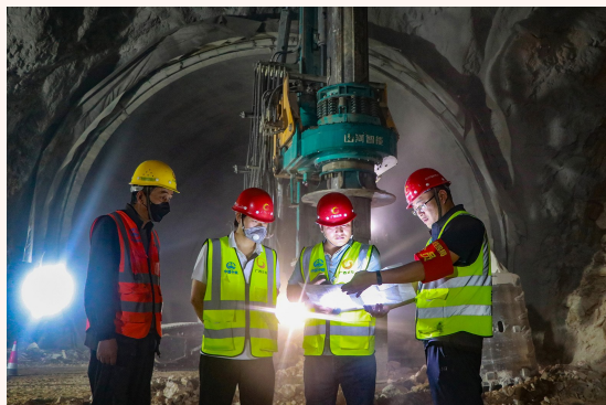
七分公司崇凭铁路2标技术团队研究隧道溶洞内桩基施工