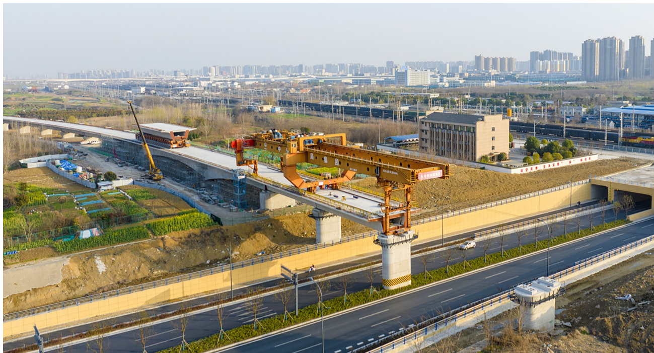
合新铁路跨铜陵路快速化路施工现场,运梁车正在进行喂梁作业

3月以来,中铁四局合新铁路HXZQ-7标施工现场一片繁忙的大干景象。该标段线路全长43.42公里,主要施工内容包括桥梁32.53公里、路基2.54公里及583孔箱梁预制和架设任务。当前箱梁已架设至合肥东2号特大桥合肥台,截止3月12日,已架完上跨铜陵北路,完成545孔箱梁架设。