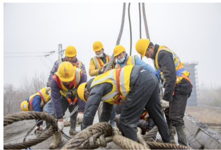
工人正在进行桥梁吊装前的绑扎固定