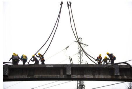
工人正在进行箱梁吊装作业