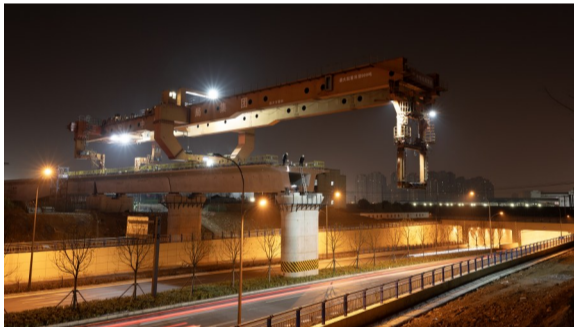
正在跨越铜陵路的架桥机