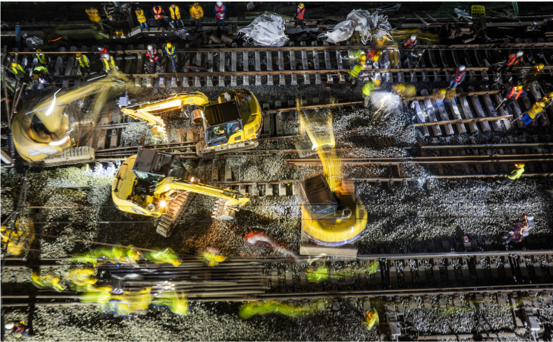
巴南高铁引入南充北站道岔插铺作业如火如荼进行中