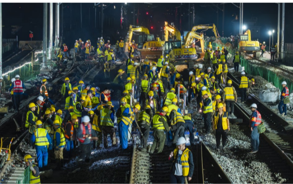
百余名工人配合施工机械进行道岔插铺作业