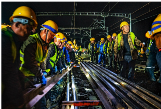
工人动作一致齐心协力抬钢轨