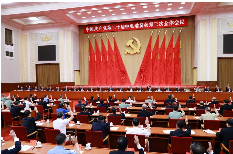
中国共产党第二十届中央委员会第三次全体会议,于2024年7月15日至18日在北京举行。中央政治局主持会议。新华社记者 王晔 摄