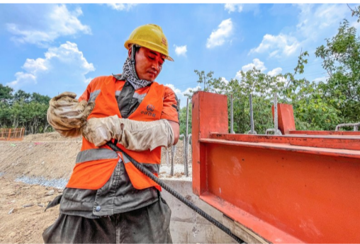
工人正在固定钢横梁