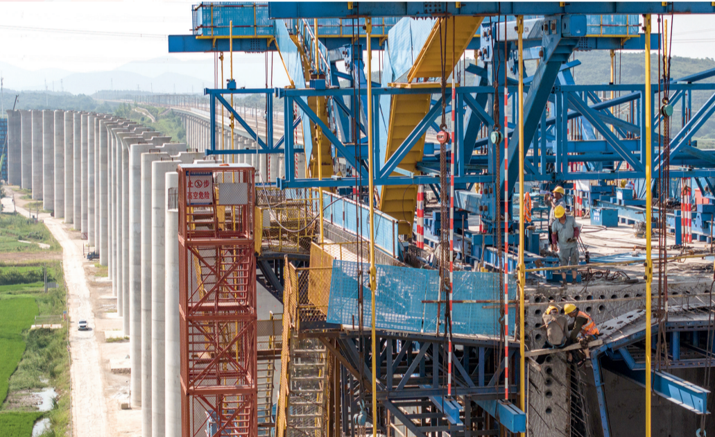
工人正在进行连续刚构挂篮施工