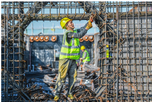
工人正在钢筋绑扎作业