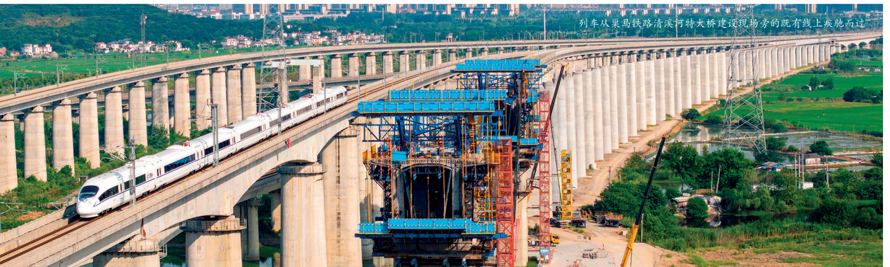
列车从巢马铁路清溪河特大桥建设现场旁的既有线上疾驰而过