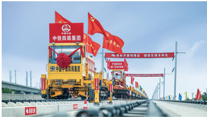
八分公司沪(上海)渝(重庆)蓉(成都)高铁武(汉)宜(昌)段项目开始铺轨

公司系统提升经营策划能力、商务管理能力和政策研究能力，善布局、敢破局，督促竣工项目做好竣工验收、优质工程创建，注重优质工程业绩积累。局第四次党代会召开以来，公司获中国建设工程鲁班奖4项、土木工程詹天佑奖5项、国家优质工