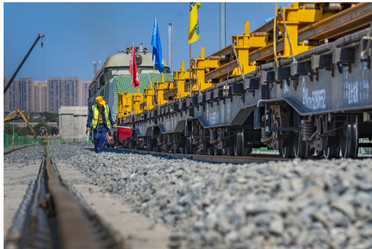
500米长钢轨运输车安全停靠