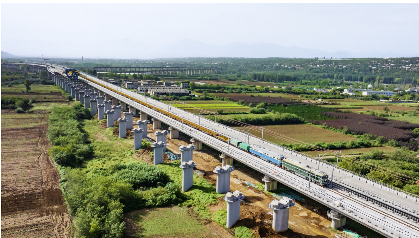
西十高铁500米长钢轨运输