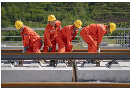
作业人员使用撬棍配合取出滚筒