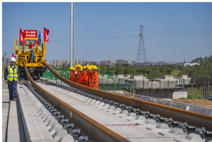
铺轨机正在牵引作业