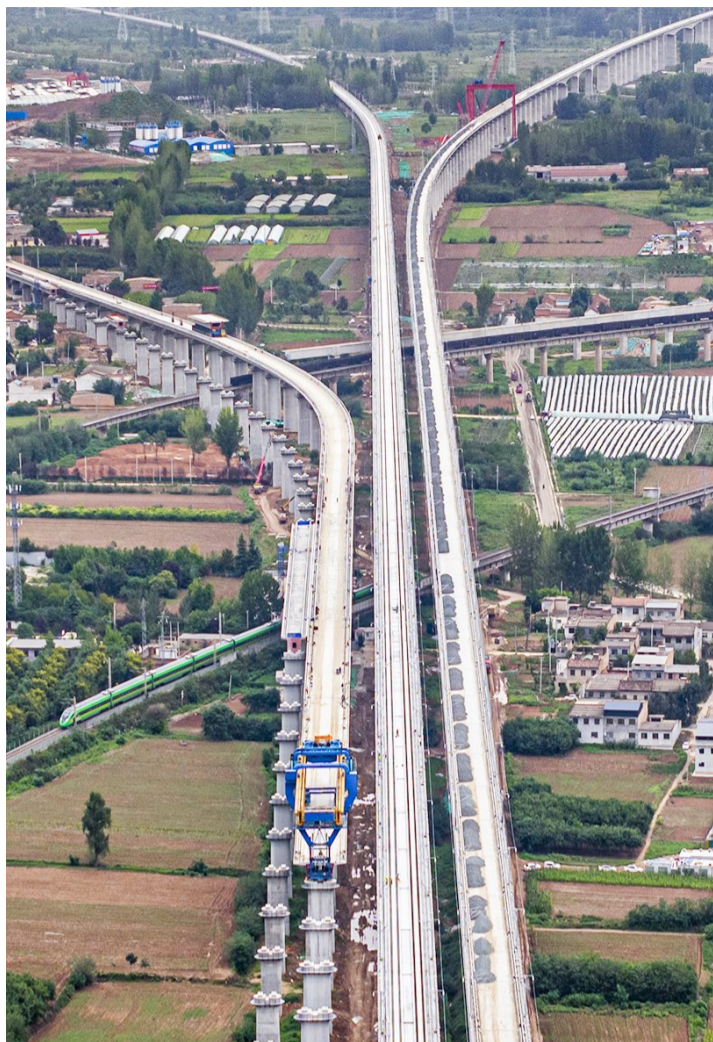
在建的西十高铁与数条铁路线路并行、交汇