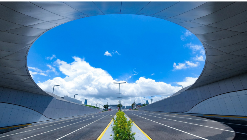
公司参建的国内首个现代化地下交通枢纽——深圳前海地下道路工程

10月10日,中铁四局安装公司“廿载征途匠心筑梦”主题展在本部开展,全面展示公司成立20年来的发展成就以及在全国各省份承建的已交付工程,吸引众多员工驻足观看,一同重温企业发展历程。