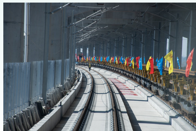
500米长钢轨运输车安全停靠作业现场