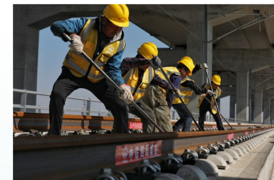
作业人员使用撬棍配合取出滚筒