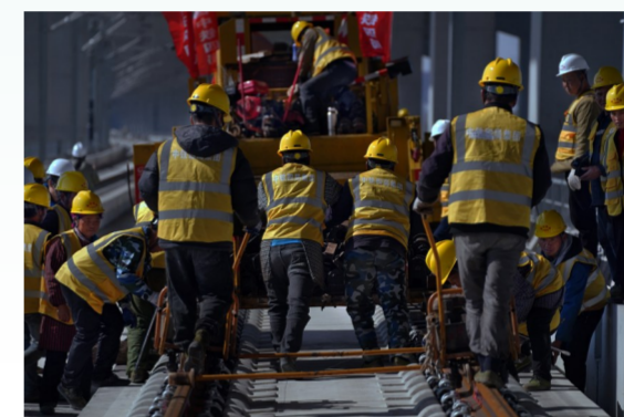
作业人员配合整理滚筒