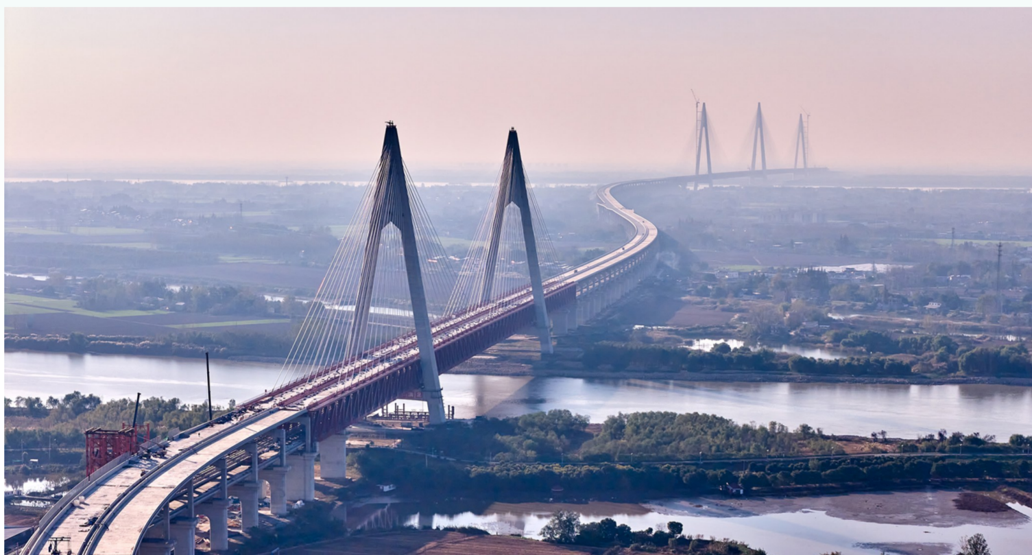
建设中的巢马城际铁路