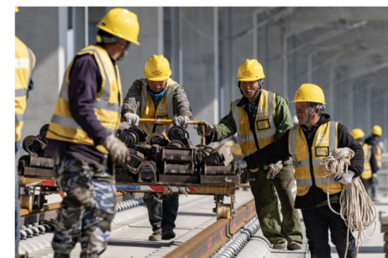
作业人员协力运输滚筒