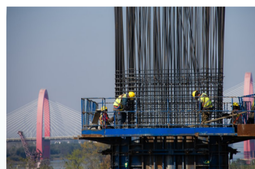
作业人员正在进行桥梁墩身钢筋绑扎