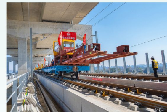
铺轨采用我国自主研发的WZ500型自动抓取式铺轨机组