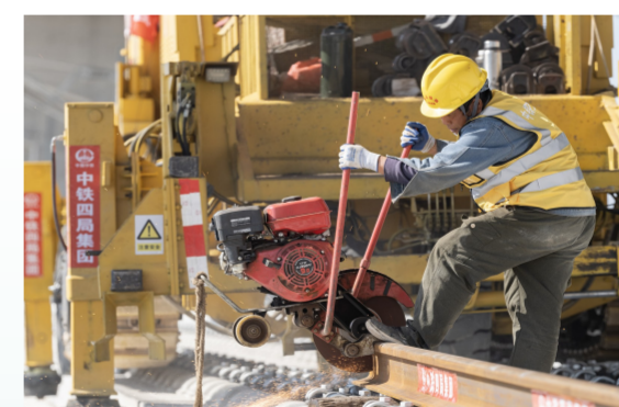
作业人员进行钢轨切割作业