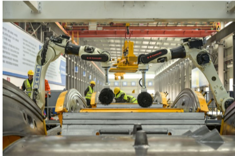
机器人正在进行模具清理作业