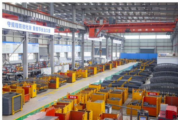
车间里摆放整齐的智能化工筋加工设备