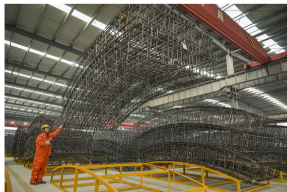
成品钢筋笼出库作业