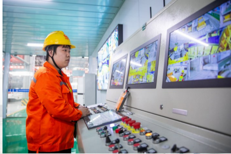
作业人员正在操作管片自动化生产线