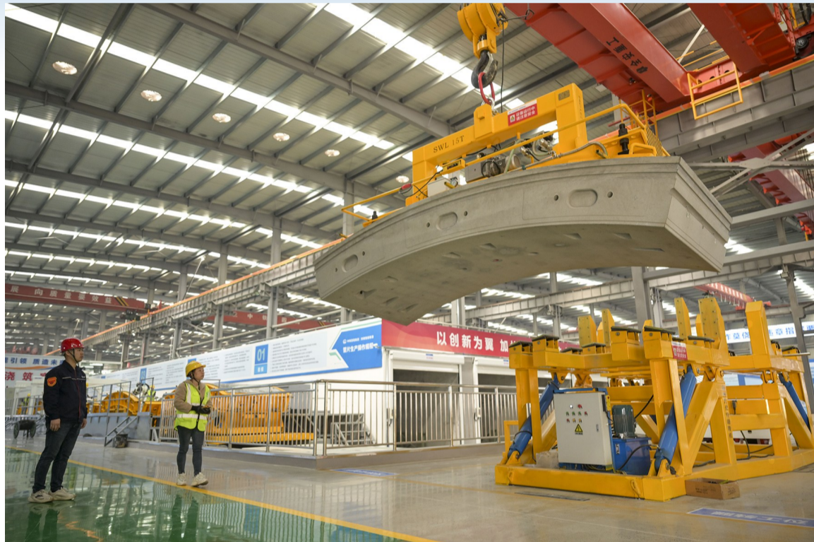
作业人员操作管片转运、姿态翻转