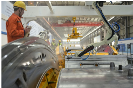
机器人正在进行脱膜剂喷涂作业