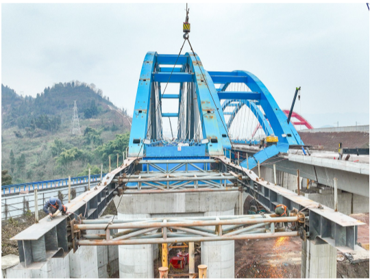
西渝高铁安康至重庆段跨营运高速公路大桥顶推施工