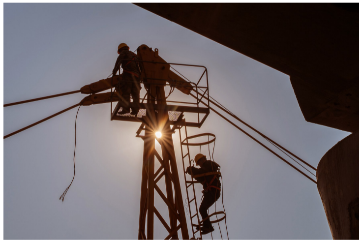
工人正在200米的高空进行塔吊拆除作业