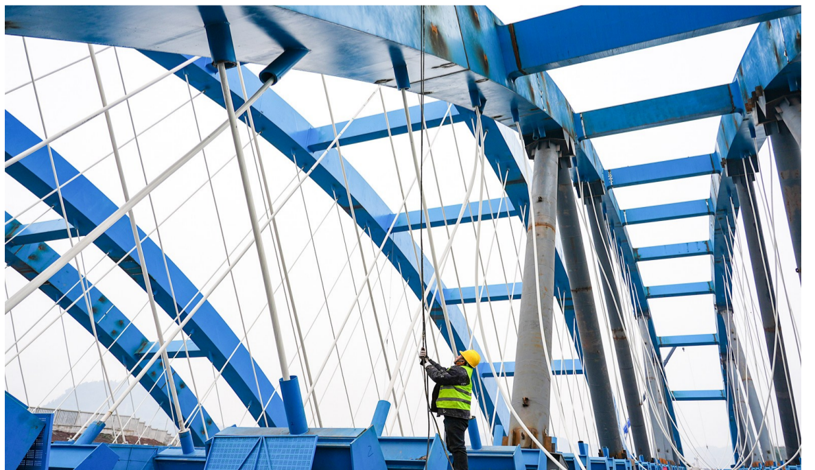
工人正在紧固吊索