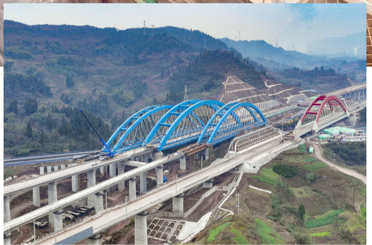
西渝高铁安康至重庆段跨营运高速公路大桥顶推施工