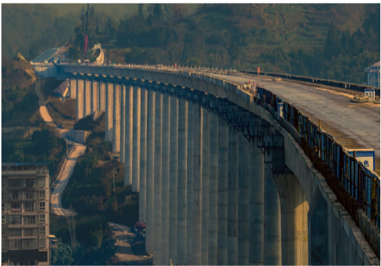
建设中的西渝高铁安康至重庆段乌龟包大桥