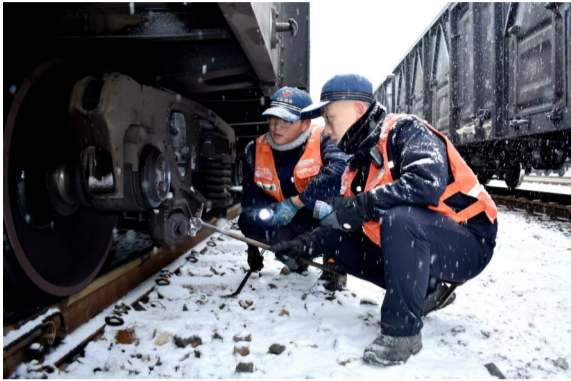
朔黄运输分处作业青年团员在风雪中检查货运列车