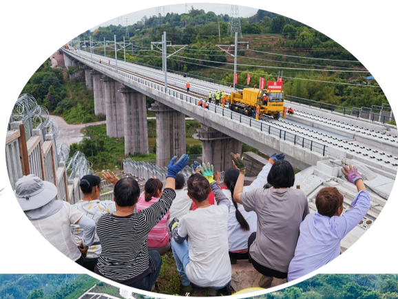
当地居民见证渝昆高铁川滇段全线开铺