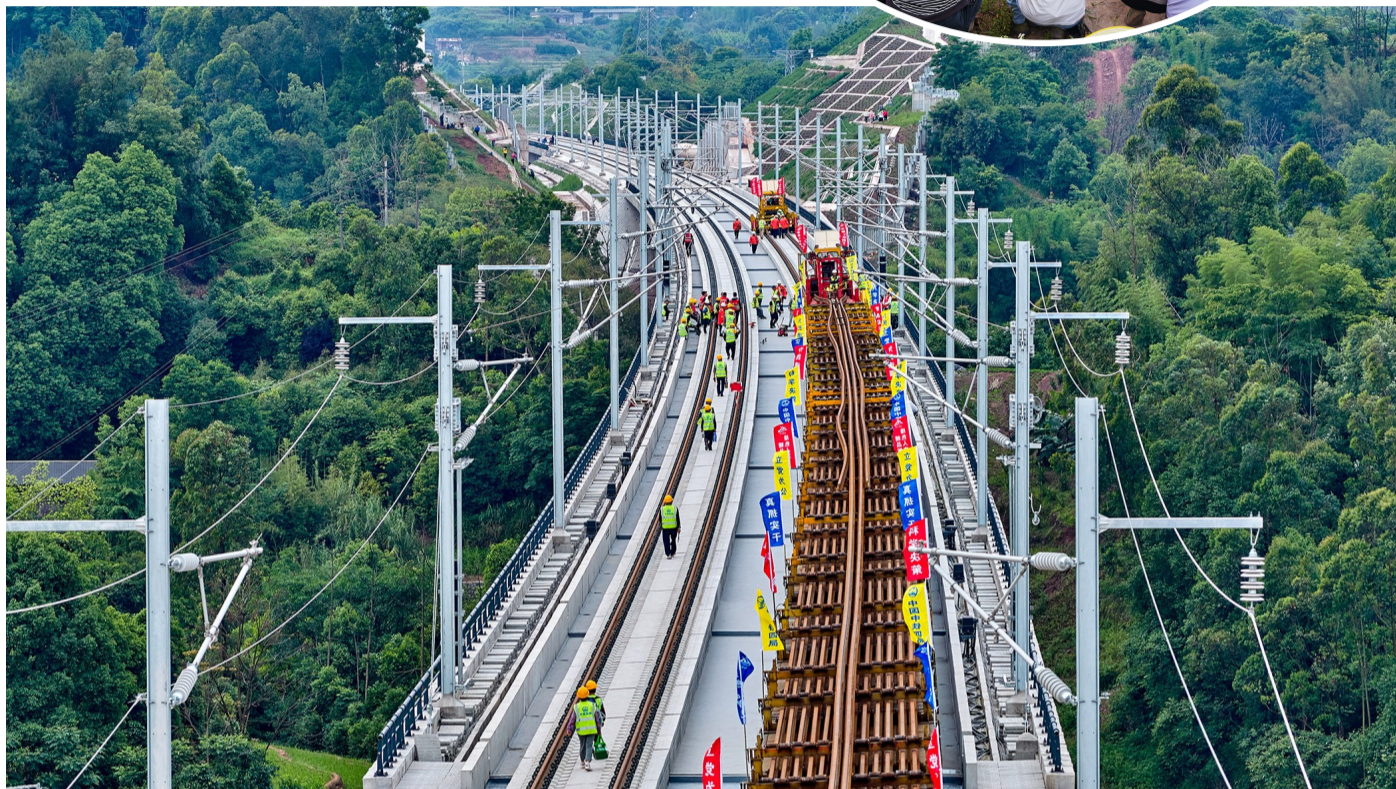
渝昆高铁川滇段全线铺轨工程启动