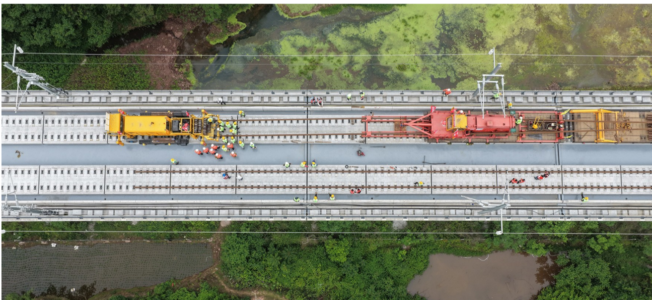
无砟铺轨机组正在进行长钢轨铺设作业