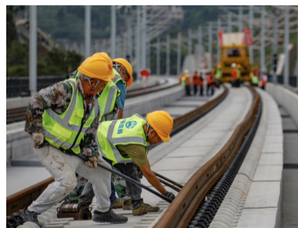
工人正在进行钢轨对位作业