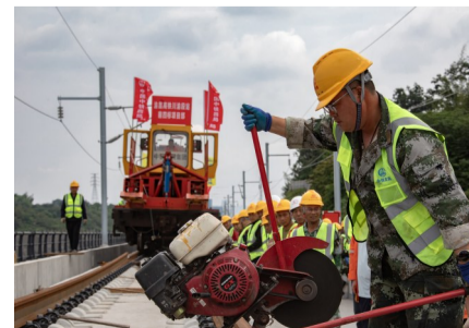
工人正在进行锯轨作业