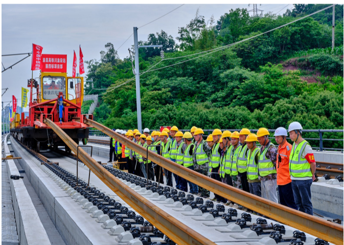
无砟铺轨机组正在推送500米长钢轨