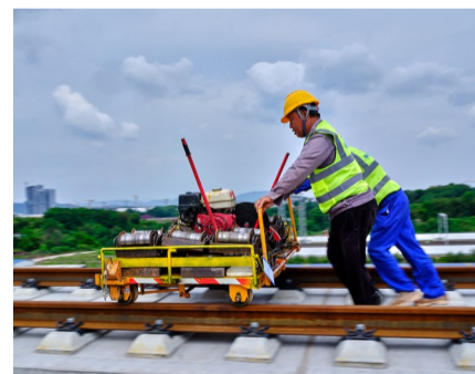
工人正在推行小型轨道作业车