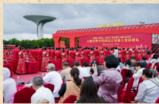
观礼嘉宾拍照留影