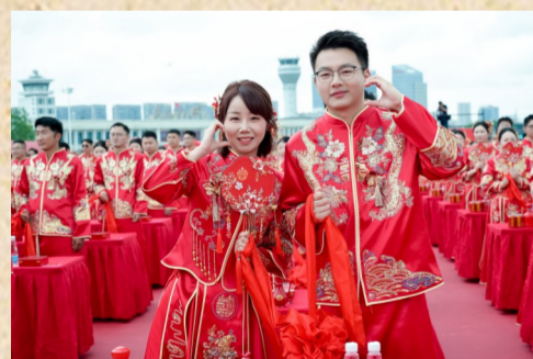
仪式现场的甜蜜互动