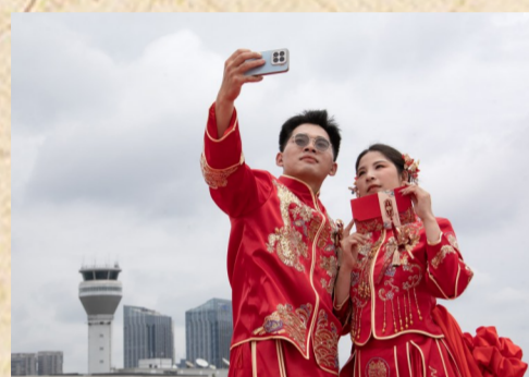
入场前的甜蜜合影