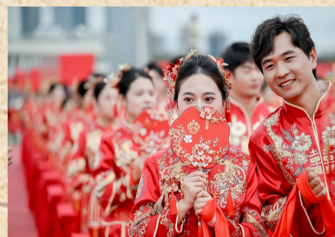
新人踏上幸福大道