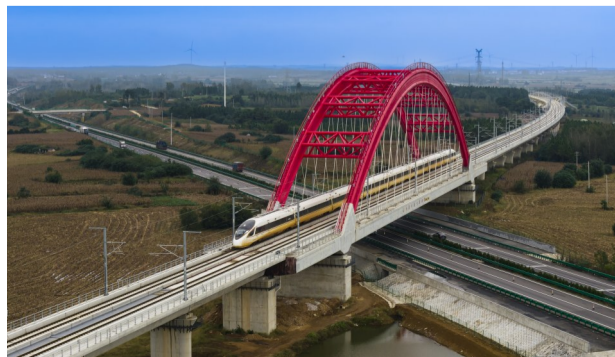
红拱飞架 高铁驰风