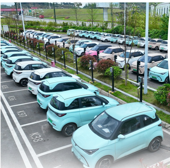
建成投用的2023年宜宾充电基础设施项目