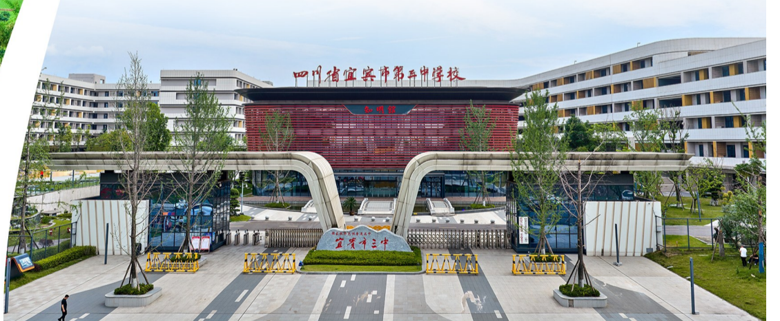
建成投用的宜宾市第三中学校三江校区