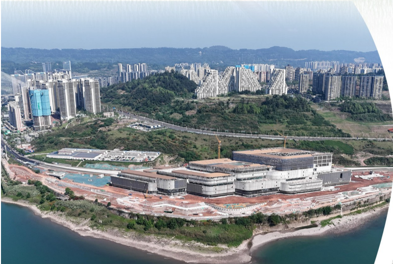
建设中的宜宾滨江C组团项目