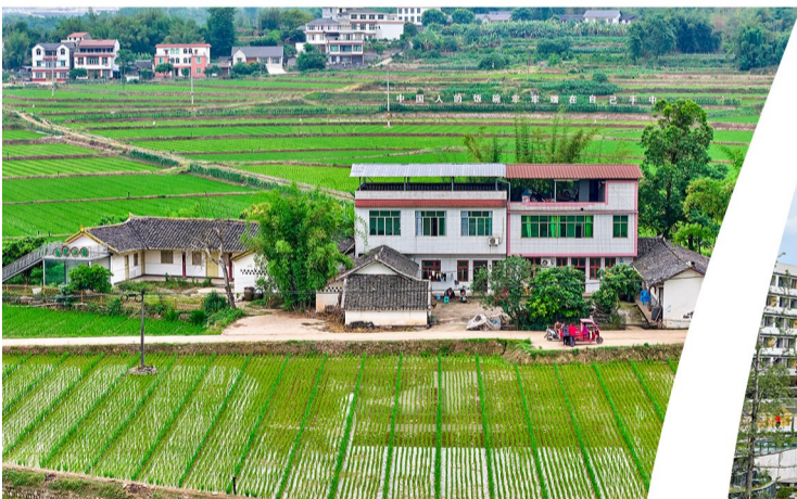
建成投用的宜宾万亩天府粮仓核心示范区项目