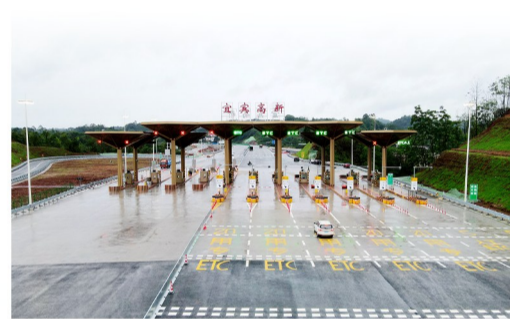
建成投用的宜宾高新互通改造工程