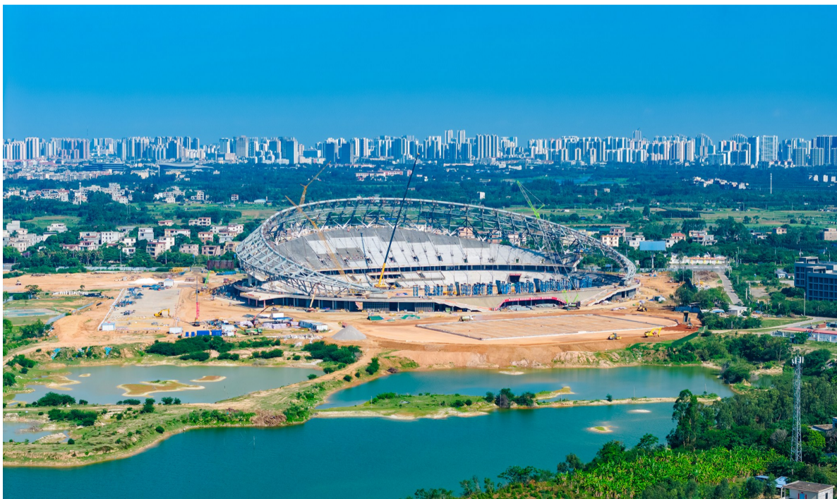
建设中的中国东盟(北海)体育实训基地项目