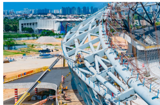
工人正在进行钢结构涂装