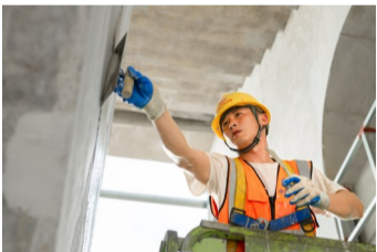
工人正在对异形柱墙面进行装饰施工