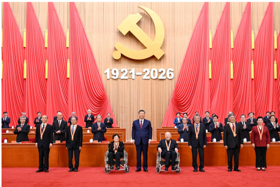
7月1日上午，庆祝中国共产党成立105周年大会在北京人民大会堂隆重举行。中共中央总书记、国家主席、中央军委主席习近平向“七一勋章”获得者颁授勋章。

本报北京7月1日电 庆祝中国共产党成立105周年大会7月1日上午在北京人民大会堂隆重举行。中共中央总书记、国家主席、中央军委主席习近平向“七一勋章”获得者颁授勋章并发表重要讲话。他强调，105年来，我们党始终坚守为中国人民谋幸福、为中华民族谋复兴的初心使命，在不懈奋斗中创造了彪炳史册的伟大成就。新征程上，全党同志要坚定信心、接续奋斗，不断创造无愧于时代和人民的新业绩。