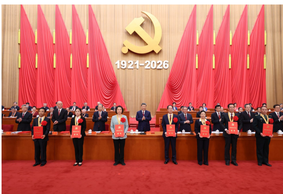
7月1日上午，庆祝中国共产党成立105周年大会在北京人民大会堂隆重举行。这是习近平等党和国家领导人为受表彰的全国“两优一先”代表颁奖。

话。他表示，今天，我们隆重集会，庆祝中国共产党成立105周年，回顾我们党走过的光辉历程，展望党和人民事业发展的光明前景，